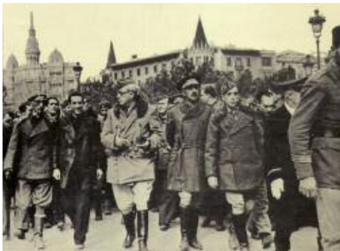
Dionisio Ridruejo (segundo por la izquierda) junto al general Yagüe, en la Plaza de Cataluña. Barcelona, 26 de enero de 1939.

Dionisio Ridruejo puede incluirse en el grupo de escritores de la Literatura arraigada a pesar de que su posición política contraria al régimen. En poesía formaron la llamada Generación del 36. Esta generación se aglutinó en torno a revistas como Escorial , fundada por Ridruejo, Juventud o Garcilaso . Entre los nombres más destacados se encuentran Luis Rosales, Leopoldo Panero, Luis Felipe Vivanco y José García Nieto. Algunos títulos de las obras de Dionisio Ridruejo son Primer libro de amor (1939), Poesía en armas (1940), Sonetos a la piedra (1943), Poesías completas de juventud (1935-1945) que fue Premio Nacional de Poesía 1950, Cuaderno catalán (1965), Casi en prosa , (1972), En breve (1975). ●